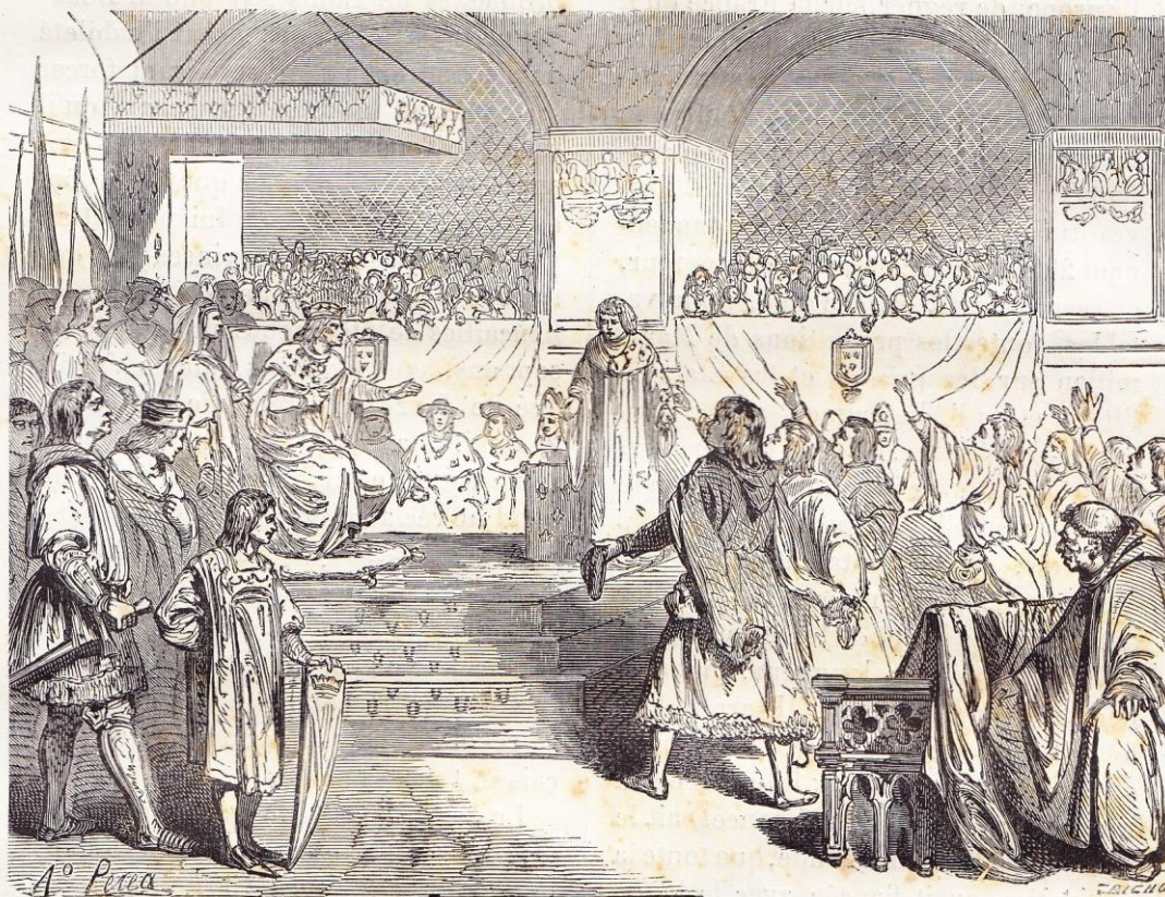
États généraux de Tours (14 mai 1505).

à craindre le même sort pour les Milanais que Maximilien s'apprêtait à faire valoir ses droits impériaux au delà des monts, et que Gonzalve de Cordoue marchait vers le nord de l'Italie; Louis divisa ses ennemis et les désarma par les traités de Blois.