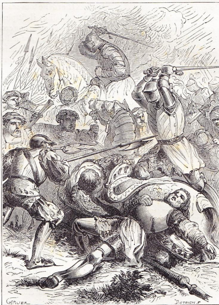
Bataille de Ravenne (1513).

Le vaillant duc de Nemours se hâtait : Louis XII était menacé de tous côtés. Henri VIII avait envoyé 10 000 hommes en Espagne pour attaquer les Pyrénées et s'emparer de la Guyenne; les Suisses